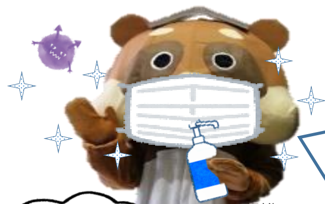
厚狭図書館 PRキャラクター