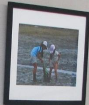
3. 二人 4. 二人