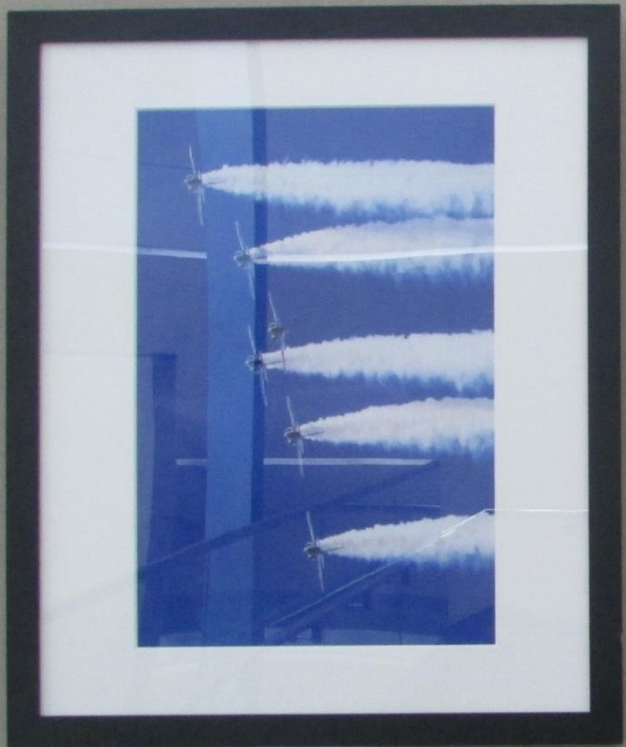
氏名 森多野 英隆 作品名 白煙の旋律 撮影 展示