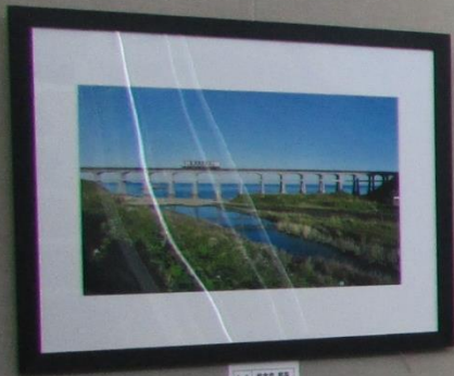
1. 橋と川 2. 橋と川 3. 橋と川 4. 橋と川