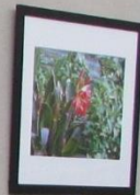
4. 花 5. 花