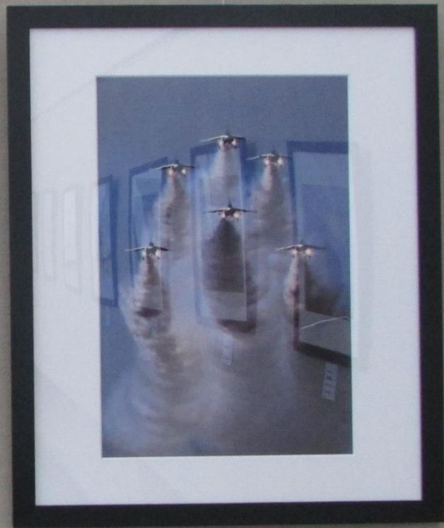
氏名 森多野 英隆 作品名 ダイヤモンド鏡像 撮影 展示