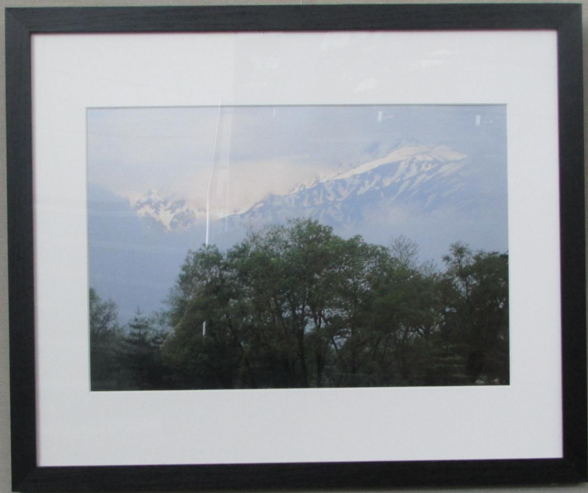
氏名 藤村宗祐 作品名 稜線の輝き 説明 雨上がりの朝 場所 長野県白馬村 おのび画廊ウツ