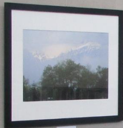
2. 山と木 3. 山と木 4. 山と木