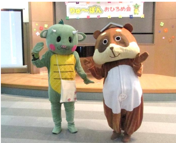
【中央図書館ゆるキャラ「りゅ〜ぽん」お披露目会】