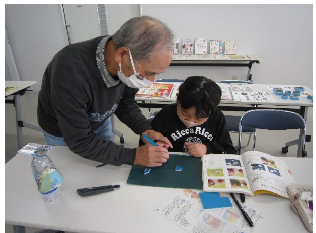
【しげさん&としさんの手づくり年賀状教室】