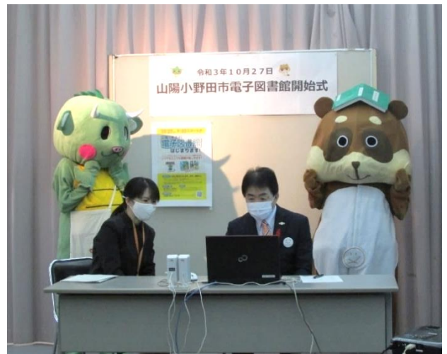
【電子図書館開始式】