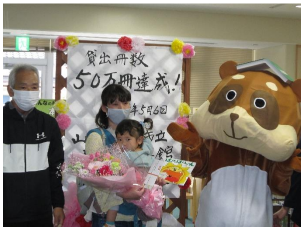
【開館後貸出冊数50万冊達成】