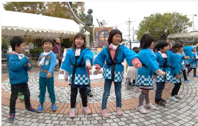
▲小野田めぐみ幼稚園によるダンス▲