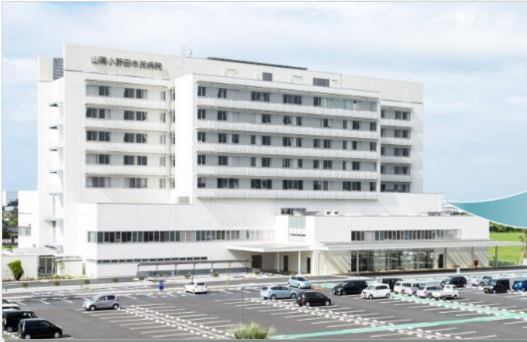
山陽小野田市立市民病院