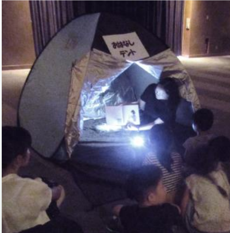
▼こわ〜いおはなし会