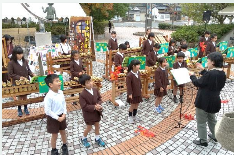
▲高泊たけのこオーケストラによる演奏▲