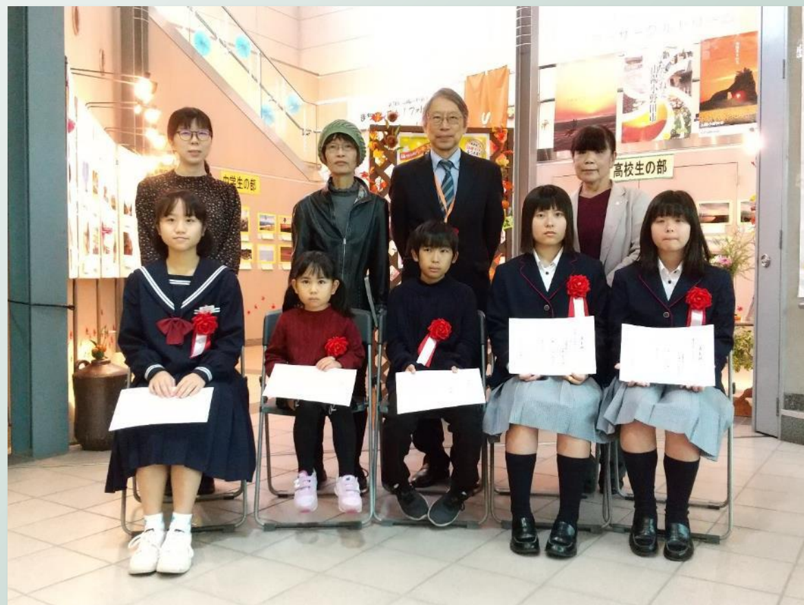
▲まちのじまん!フォトコンテスト授賞式▲