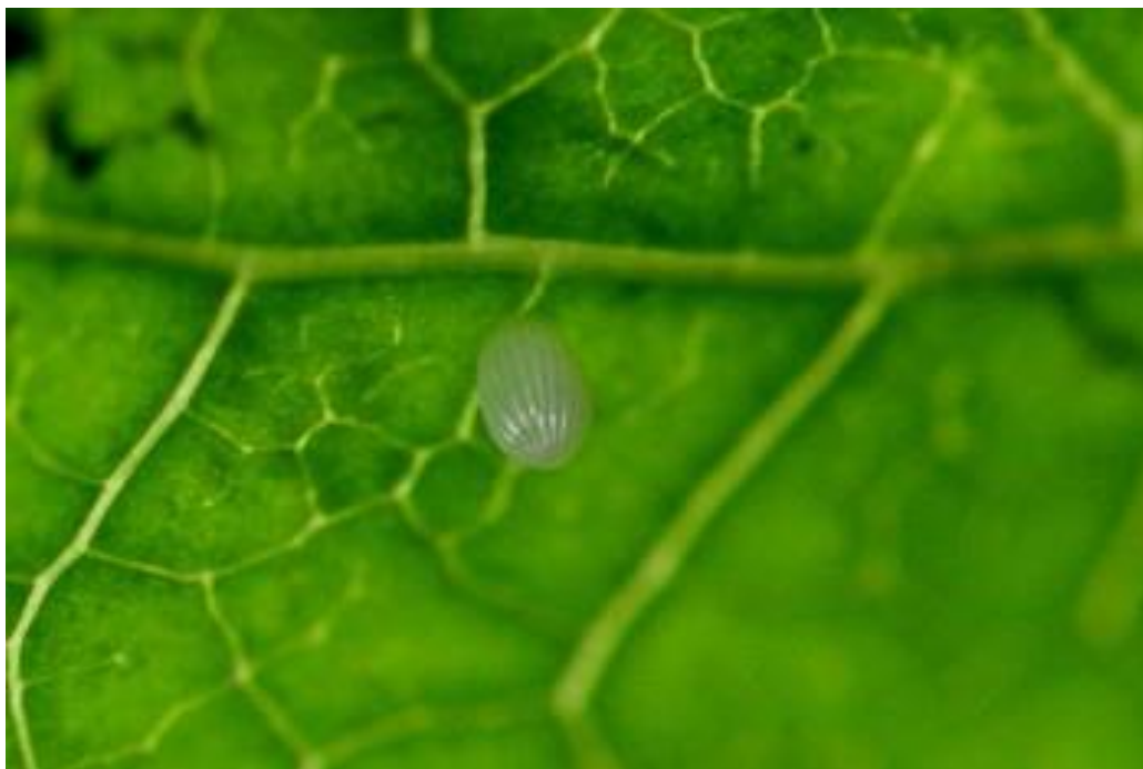
▲アサギマダラの卵(撮影/2018年10月10日)

10月になると南下の途中に立ち寄るのみと思っていたが、産卵しているとは驚きであった。竜王山にはアサギマダラが産卵するイケマが自生している。(本土ではキジョランにも産卵する)これらはアサギマダラの食草である。